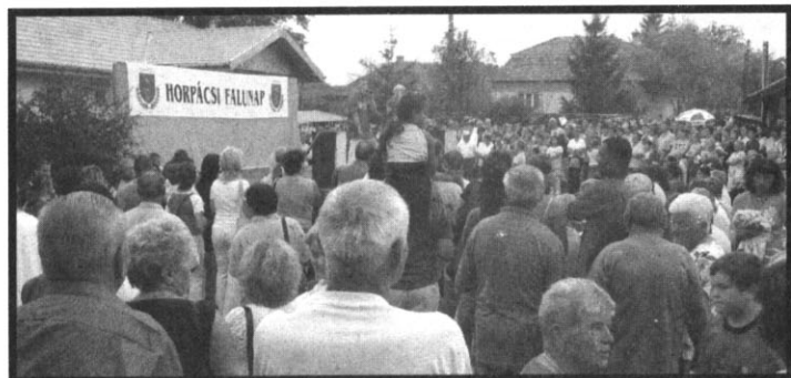
A falunapot idén szeptember 9-én rendezik

Bevezetőmben fölvettem a kérdést: hogyan élnek ma a horpácsiak? Nem könnyen, mint sehol máshol az országban. De bizakodóan, mert ennél csak jobbnak kell jönnie, és vidáman, mert szép az élet ebben a szép kis faluban.